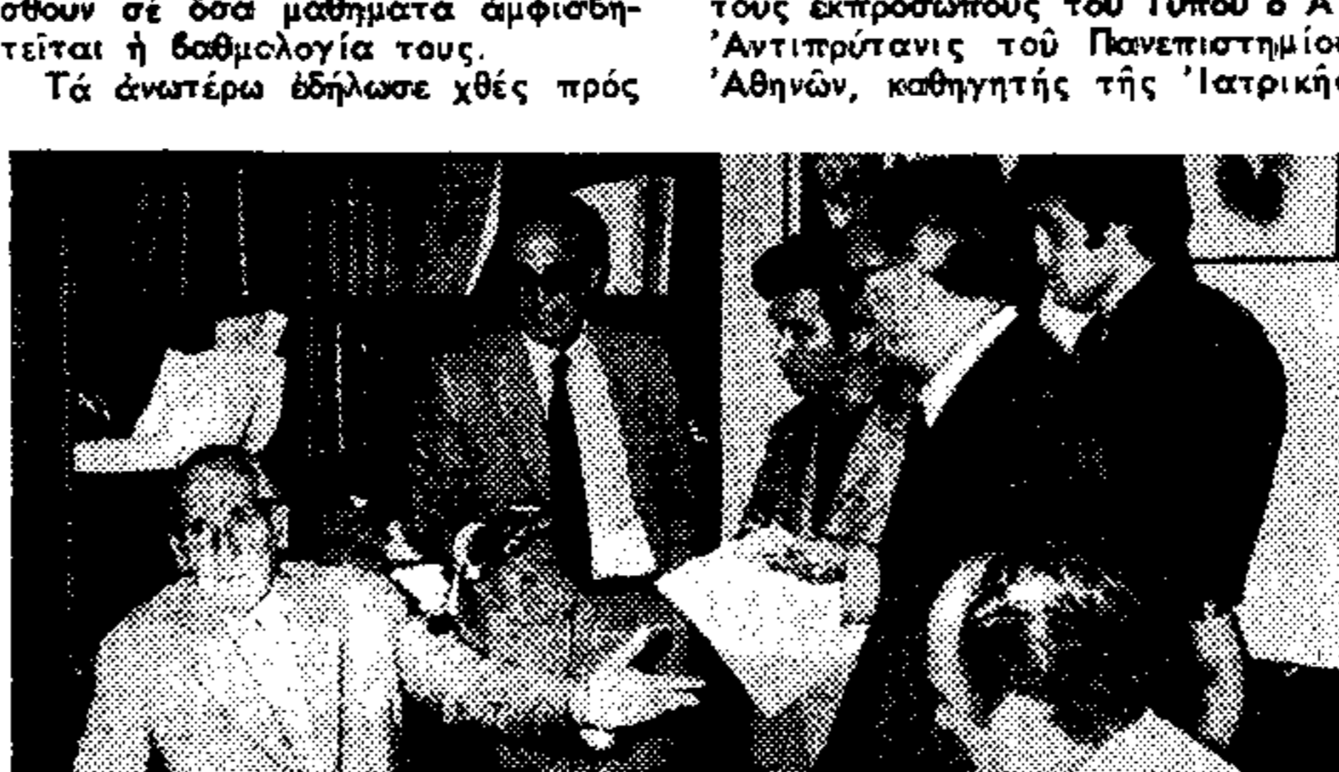
Ο πρύτανης και ά αντιπρύτανης...